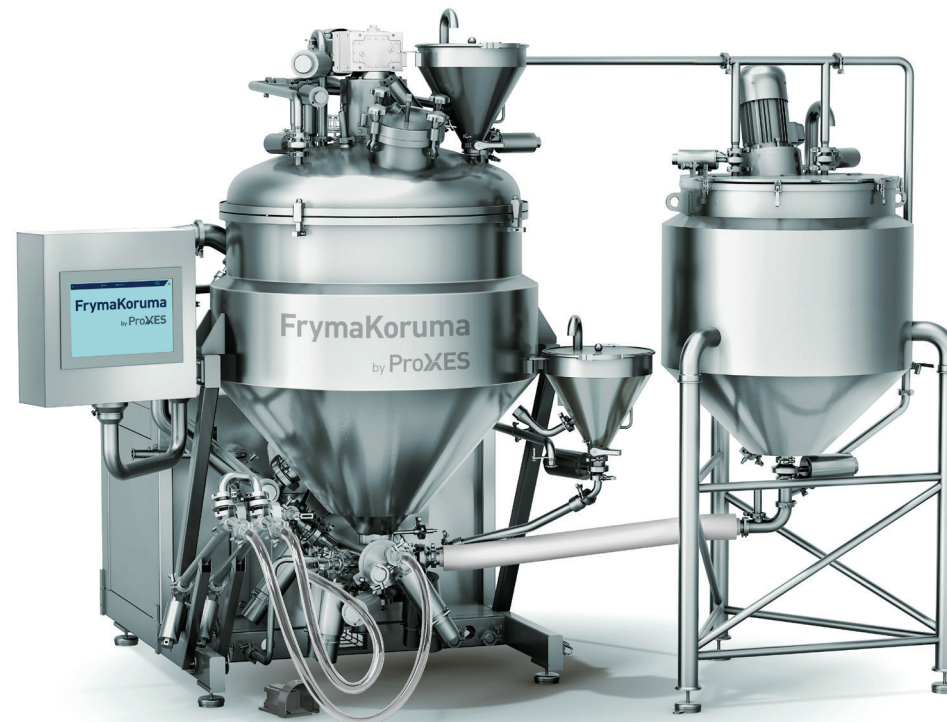
DINEX® Mélange à fort cisaillement