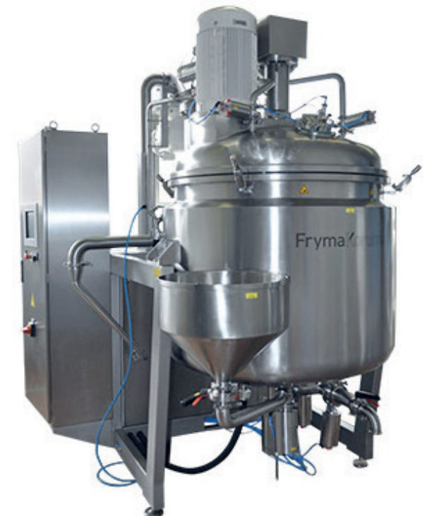
VME Mélange et dispersion